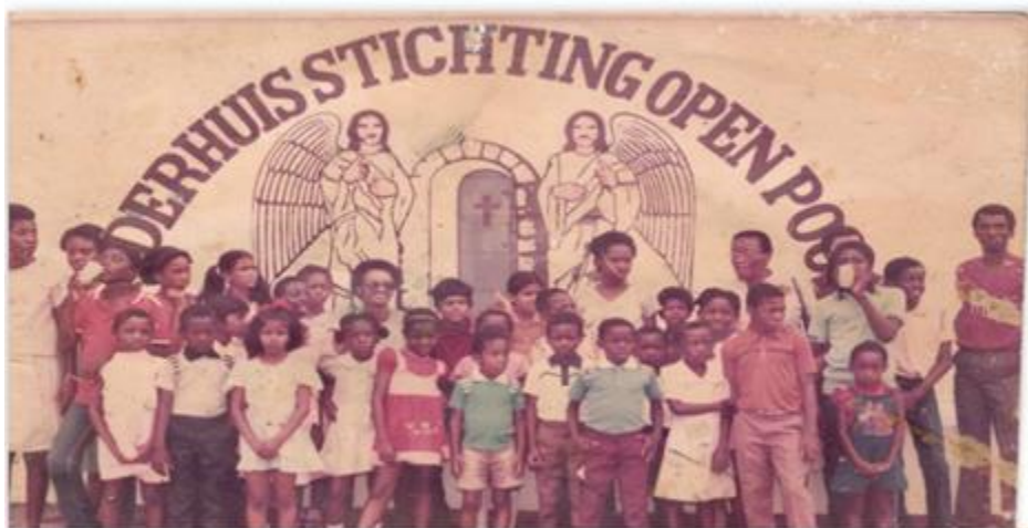
HET KINDERHUIS / JAAR 1985

De kinderen hebben de toekomst. Hoe ze daartoe worden toegerust kunnen wij mede bepalen! Het is ons een waar genoegen u te mogen meedelen dat het Olga Clarck kinderkhuis dit jaar met Gods genade, haar 45ste jubileum heeft mogen vieren op 1 september 2018 door een dankdienst te houden. Wij zijn de Here Jezus dankbaar dat ondanks de economische situatie wij door zijn genade ons hoofd boven water hebben kunnen houden. Wij willen u ook van harte bedanken voor uw royale financiële en geestelijke ondersteuning in de directe noden van alle dag die bedoelt is tot wijzijn,ontwikkeling en groei naar volwassenheid van het Surinaams,Nickeriaans kind. In de achterliggende 45 jaren hebben wij verwaarloosde, achtergestelde,verslaafde,mishandelde en sexueelmisgebruikte kinderen opgevangen.Om ons werk te kunnen blijven verrichten, is uw financiële en materiële ondersteuning noodzakelijk. Met uw gift maakt u het ons mogelijk de komende jaren deze kinderen te blijven ondersteunen. Uw hulp is daarbij absoluut onmisbaar!