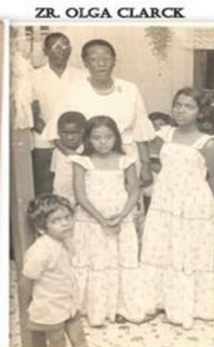
JAAR 1970 - 1980