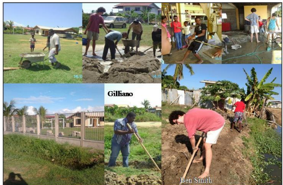
Indrukken van de bouw van de schutting

The Olga Clarck Children's Home thanks you for your loving gesture. We are grateful for the financial and material support that benefit our children. We thank you all and may God bless you.